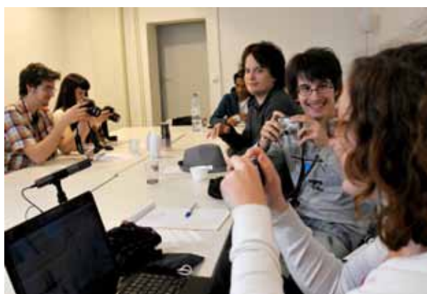
Journée d'atelier à La Chambre